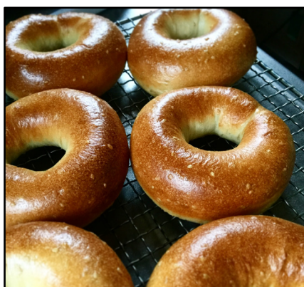
ベーグル by 1DAYBAKERY