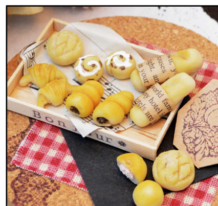
粘土クラフトパンセット講座