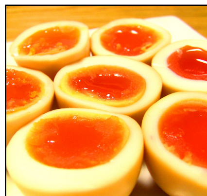
半熟卵のスモーク by 日和佐燻製工房