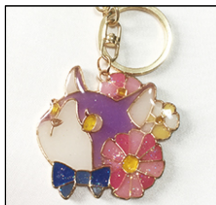
UVレジン講座 by アトリエ＊シュクレ