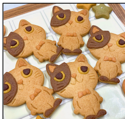
天然素材の動物クッキー by monjuillet