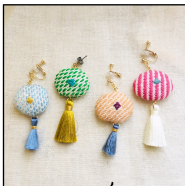
出品例 こぎん刺しアクセサリー

全国各地から集まるものづくり市民による、アクセサリーやインテリア・雑貨、靴・カバン、伝統工芸、ファッションなど、プロの作品と比べても遜色ない 個性的・高品質な10,000点以上の手づくり作品 が会場を埋め尽くします。また、ケーキやクッキー、パン、はちみつ、紅茶など、こだわりの手作りフードも出店され、ここでしか出会えない様々な種類のハンドメイド作品を楽しめます。