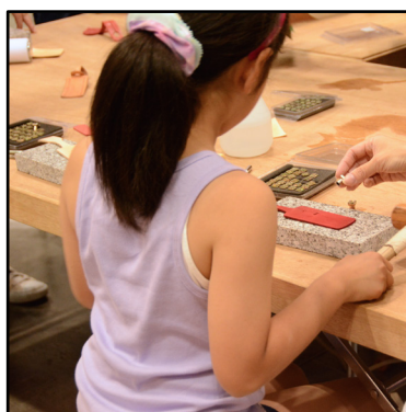
体験教室の様子・1

体験教室は講座ごとに1,500円～3,000円の参加費で参加することができ、ハンドメイドマルシェにおける「コト消費」コンテンツとして人気のプログラムです。