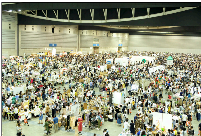
ヨコハマハンドメイドマルシェ過去開催の様子

神奈川最大のハンドメイドイベントとして、2013年の初開催からこれまで9回開催しているものづくり市民による出店型イベント「ヨコハマハンドメイドマルシェ」。昨年5月の開催では、全国から集った2,800人のものづくり市民による様々な手づくり作品が出店され、22,000人を超える方々が来場しました。