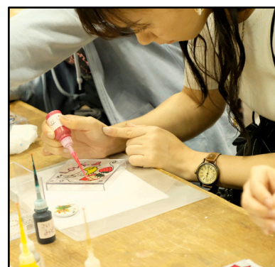
体験教室の様子・2