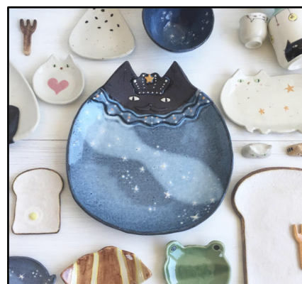
猫や食パンモチーフのお皿 by 716