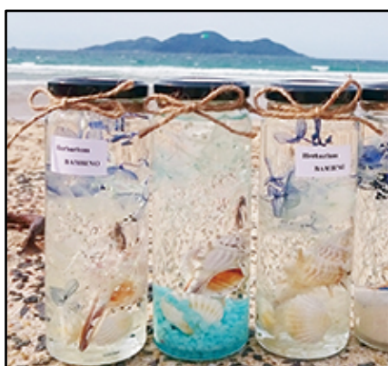
ハーバリウム講座 by BAMBINO