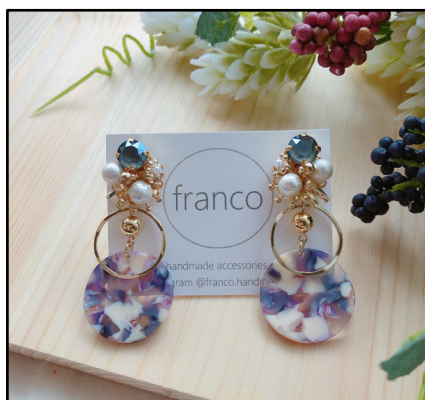
イヤークセサリー by franco