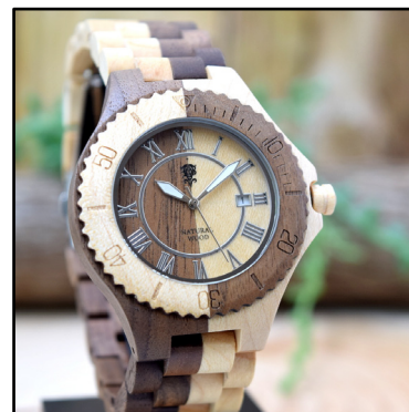
出品例 天然木の腕時計